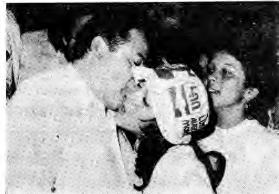
ALEGRIA.—Una simpatizante de la tendencia de don Luis Alberto Monge Alvarez, abraza al candidato presidencial del Partido Liberación Nacional, al conocerse su triunfo en las elecciones primarias desarrolladas ayer en todo el país.

candidato que deberá enfrentarse a los grupos anti-liberacionistas”.