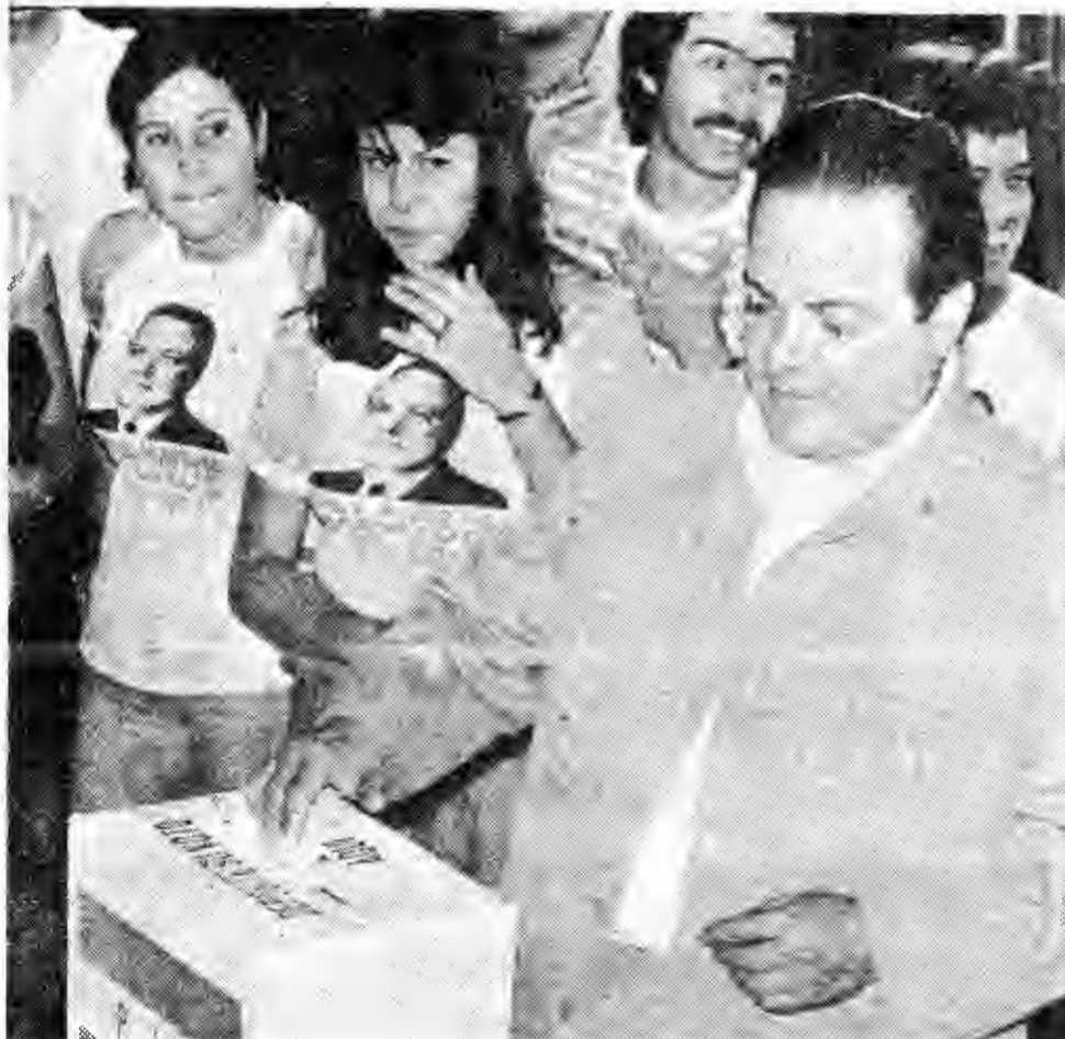
Don Luis Alberto Monge Alvarez triunfó ayer por amplio margen sobre la tendencia de su copartidario, don Hernán Garrón Salazar, durante los comicios que se realizaron con motivo de la convención liberacionista. Monge Alvarez votó en el salón La Primavera, en San Rafael de Escazú

Finalmente, don Luis Alberto expresó a La Nación, en medio del barullo provocado por su triunfo que atrajo a miles de personas a su casa, que “ahora voy a tomar dos o tres semanas para trabajar más de cerca