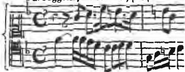
a 2. Soggetti, di Händel, p. 14.