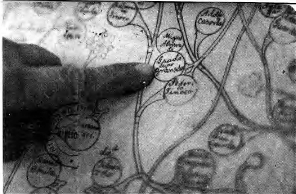
Treinta y cinco páginas del "Album de Figueroa" están dedicadas a uno de los más sorprendentes y completos estudios de genealogía que se han hecho en el país. Obsérvese en una de las "hojas" de este "árbol", el nombre de Joaquín Tinoco. (Sánchez)