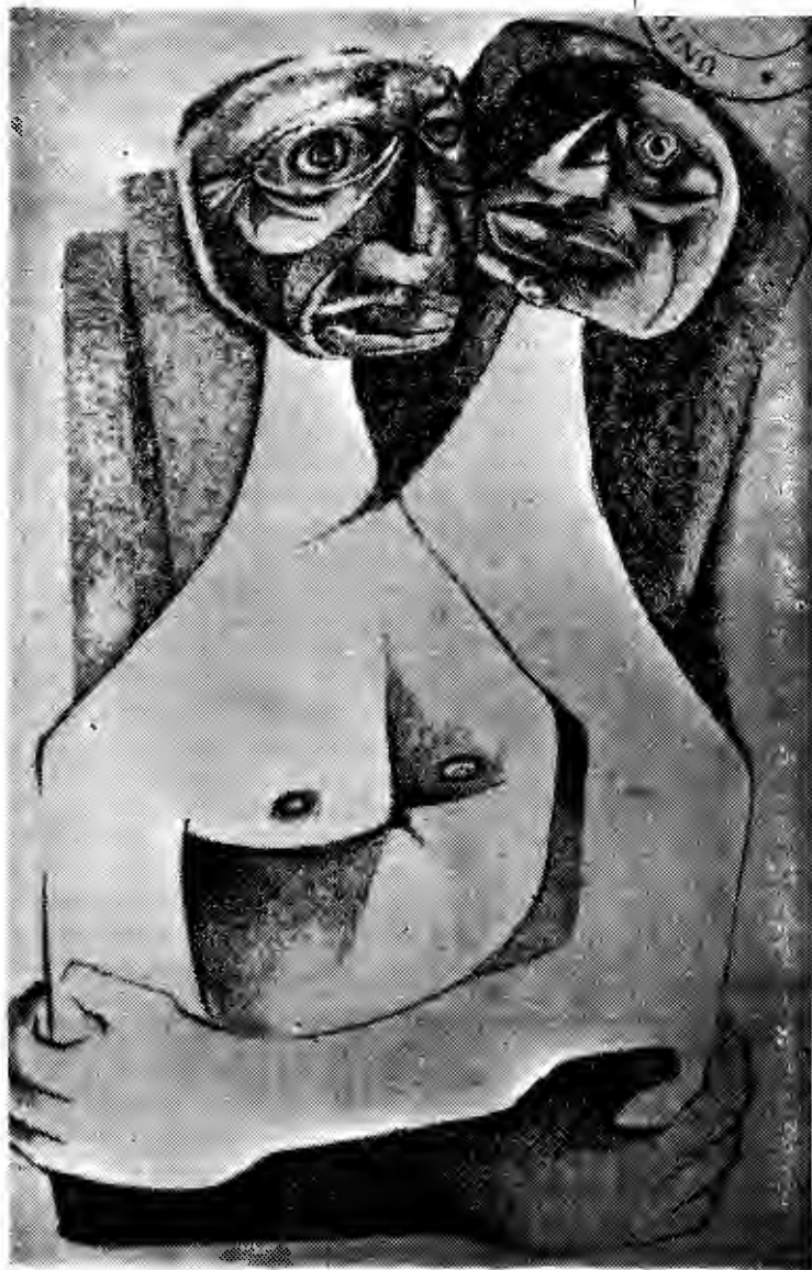
Dibujo de línea moderna, figura bicéfala, sumamente interesante