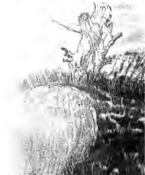
"Paisaje del norte" es el nombre de este grabado. Forma parte de la colección que se exhibe en el Museo de Arte Costarricense.

La exhibición estará abierta por un mes, de martes a domingo, de 10 a.m. a 5 p.m.