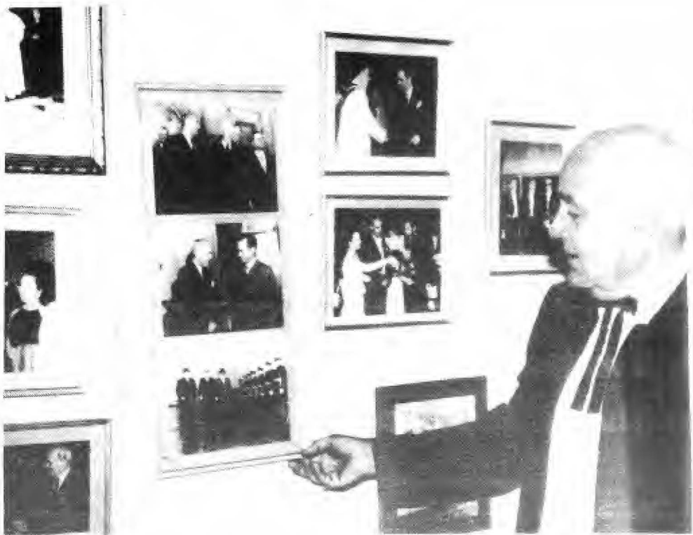
Hoy, abril 1984, Mario Echandi Jiménez expresa lo que piensa sobre Costa Rica. Aparece en la oficina de su casa en barrio González Lahmann.