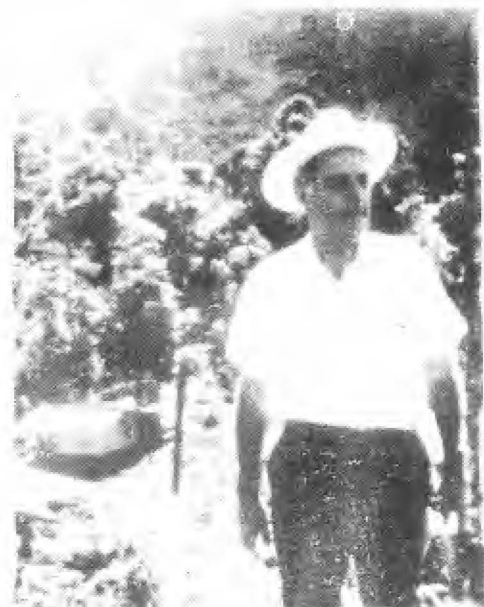
FINQUERO. En Cascajal de San Isidro de Coronado pasa mucho de su tiempo en contacto con la naturaleza.

"Buenas noches, padre" "Aquí está tu hijo" "Vengo a rendirte cuentas"..